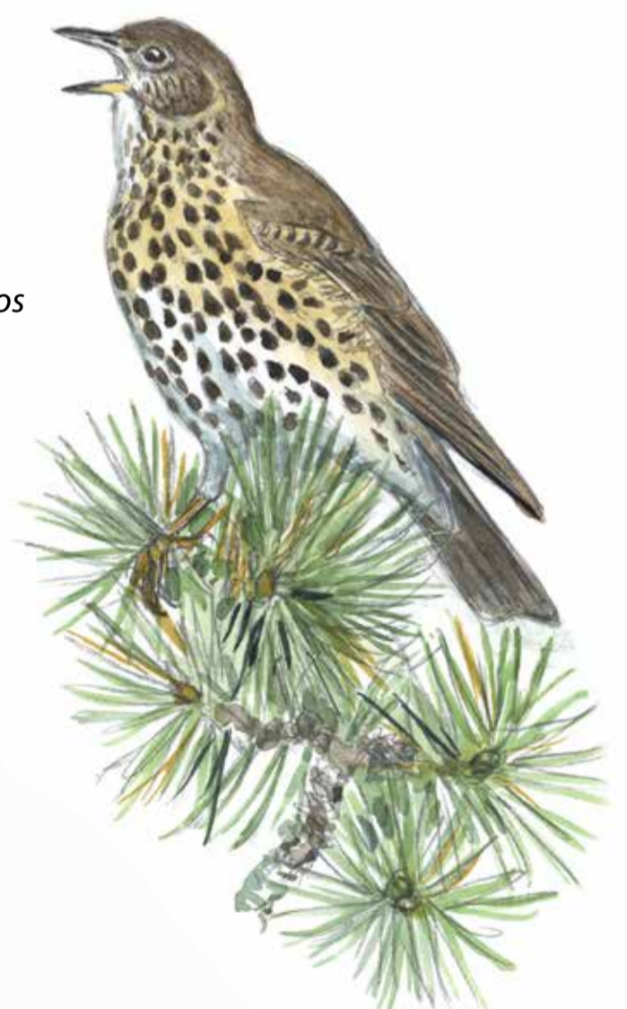
Taltrast Turdus philomelos Song thrush

P Sunnerbohallen (med tillgång till omklädningsrum och WC)