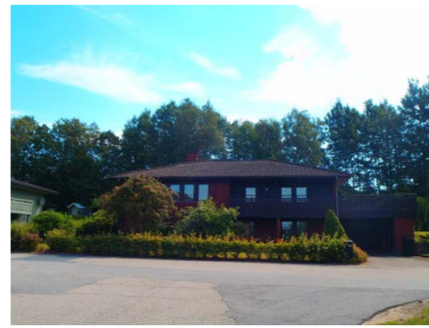
Spillkråkan 3, Blåhakevägen 5.

Stor bostadsbyggnad med två våningar som uppfördes omkring år 1910. Byggnaden är påkostad med kolonner och taket består av betongplattor i röd kulör. Fönstren är spröjsade och i olika storlekar. Trädgården, som är stor och lummig, kantas av en stenmur.