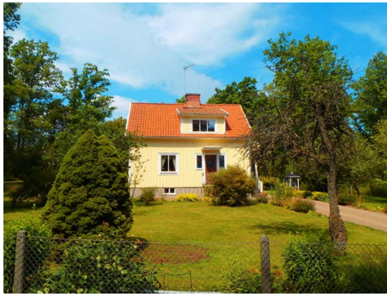
Hångers 3:3, Rödhakevägen 11

Villa med två våningar uppförd under 40-talets andra hälft. Fasadmaterialet består av stående träpanel i gul kulör. Huset har sadeltak, vilket är beklätt med betongpannor, samt en takkupa med tillhörande fönster med tre luft. Övriga fönster har två luft och är symmetriskt placerade på fasaden. Byggnaden innehåller källare.