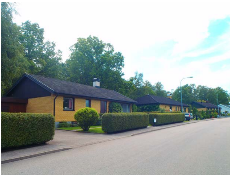
Gulmesen 1-6, Fågelsångsvägen

Utmed Ekebacksvägen finns kedjehus med likartad karaktär, vilka byggdes på 80-talet. De består av ett och ett halvt plan och har komplementbyggnader med liknande byggnadsutformning. Huvudbyggnaderna har sadeltak beklädda med betongpannor och fasadmaterialet av tegel. Totalt finns det 18 kedjehus på Ekebacksvägen. Kvarteren Hussvalan, Ladusvalan och Backsvalan består av sex hus vardera, vilka samtliga är sammanbyggda i par.