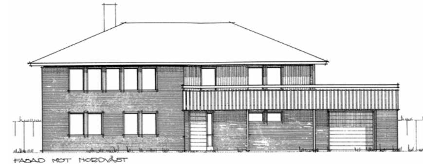
Spillkråkan 3, Blåhakevägen 5. Fasad mot nordväst

Tvåplansvilla på Blåhakevägen, uppförd på slutet av 70-talet, efter ritningar utförda av Hans Petersson, AB Rottne Hus. Villan har fasadtegel och enlufsfönster. På ovanvåningen finns ett stort fönsterparti bestående av en grupp av enlufsfönster. Huset har ett tak av mansardtyp som täcks av betongpannor. Till byggnaden hör även en balkong med garage i bottenvåning. Trädgården är lummig med mycket växtlighet.