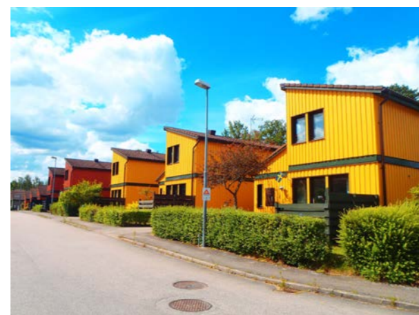
Kvarteret Blåhaken och Tofsmesen, Tofsmesvägen och Gärdsmyggen