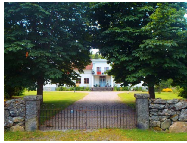
Näktergalen, Trastvägen 3

På Fågelsångsvägen återfinns välbevarade villor uppförda på 70-talet. De har fasad i tegel, somliga med halvvåningar i stående träpanel i mörk kulör. Fönster med en luft eller två luft förekommer. Majoriteten av villorna har sadeltak, dock förekommer även brutna tak. Samtliga husens tak täcks av betongpannor.