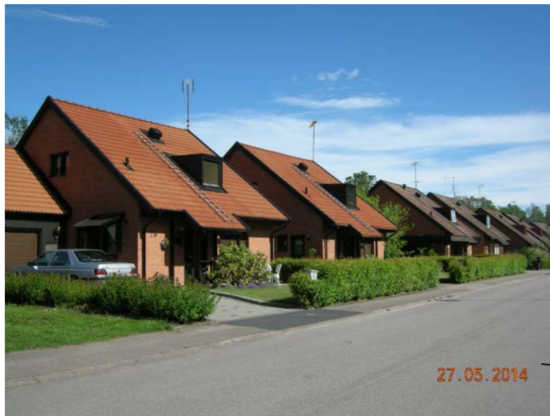
Kvarteren Ladusvalan, Hussvalan och Backsvalan, Ekebacksvägen

Villa med två våningar uppförd under 40-talets andra hälft. Fasadmaterialet består av stående träpanel i gul kulör. Huset har sadeltak, vilket är beklätt med betongpannor, samt en takkupa med tillhörande fönster med tre luft. Övriga fönster har två luft och är symmetriskt placerade på fasaden. Byggnaden innehåller källare.