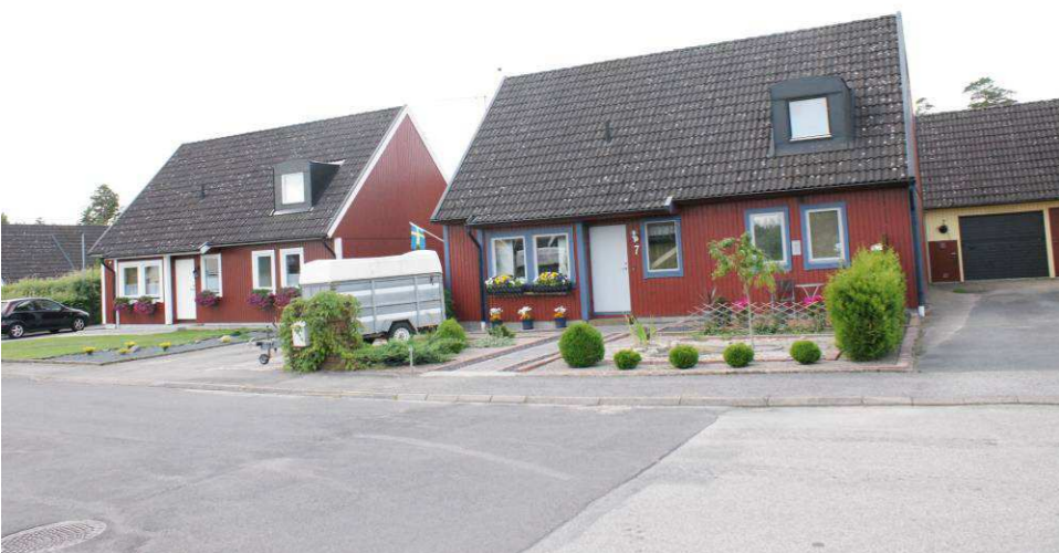
Säden 4 och 5, Flintvägen 7 och 5

På Flintvägen finns kedjehus med liknande karaktär som byggdes på 70-talet. De har ett plan och är byggda i vinkel. Husens komplementbyggnader har liknande byggnadsutformning som huvudbyggnaderna. De har sadeltak med betongpannor och dess fasadmaterial är träpanel i olika kulörer samt gult fasadtegel. Totalt finns det 16 kedjehus på Flintvägen, vilka är byggda i en halvcirkelform. Ritningar till husen har utförts av IB Wibroe.