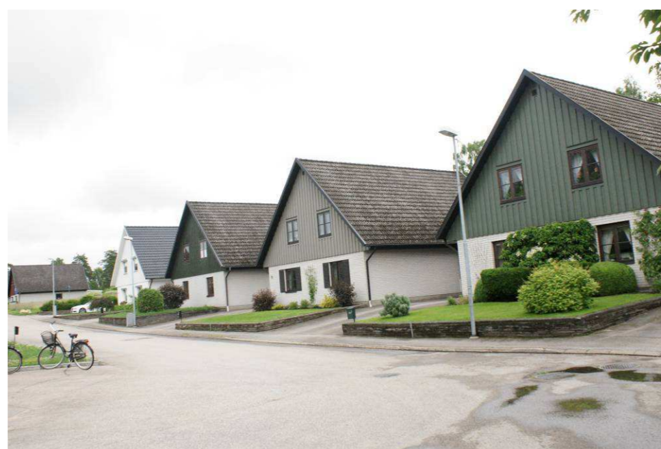
Nässelkålen 4 m.fl., Diabasvägen 8 m.fl.

Grupp med kedjehus som uppfördes i mitten av 70-talet. Husen har ett och ett halvt plan och liknande karaktär. Fasadmaterialiet är vitt sandstenstegel och stående träpanel i olika kulörer på röstena. Fönstren är symmetriskt placerade på fasaden och har mittpost samt spröjs. Husens sadeltak täcks av betongpannor. Arkitekt för kedjehusen var Produktor bygg AB.