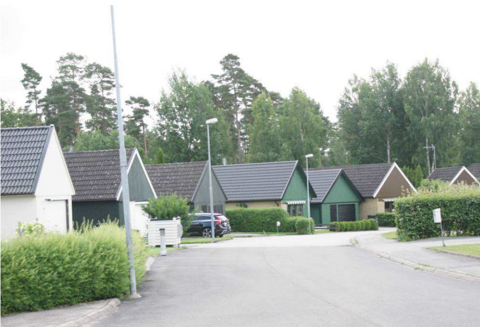
Kornet 1 m.fl., Flintvägen 48 m.fl.

På Flintvägen finns kedjehus med liknande karaktär som byggdes på 70-talet. De har ett plan och är byggda i vinkel. Husens komplementbyggnader har liknande byggnadsutformning som huvudbyggnaderna. De har sadeltak med betongpannor och dess fasadmaterial är träpanel i olika kulörer samt gult fasadtegel. Totalt finns det 16 kedjehus på Flintvägen, vilka är byggda i en halvcirkelform. Ritningar till husen har utförts av IB Wibroe.