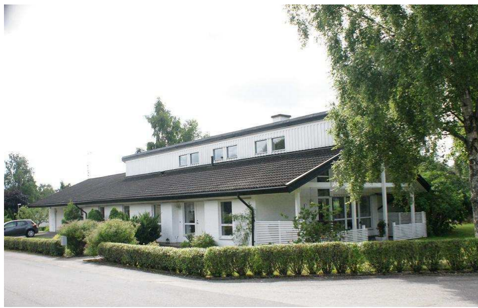
Krusbäret 1, Glimmervägen 3

Stor enplansvilla som uppfördes i början av 80-talet efter ritningar av Lennart Nelssons arkitektkontor. Fasadmaterialiet är i huvudsak puts, träpanel täcker överbyggnadens fasad. Villan har sadeltak som täcks av betongpannor. Fönstren har en luft och är symmetriskt placerade på fasaden, de på bottenvåningen har spröjs i fönstrens nederkant.