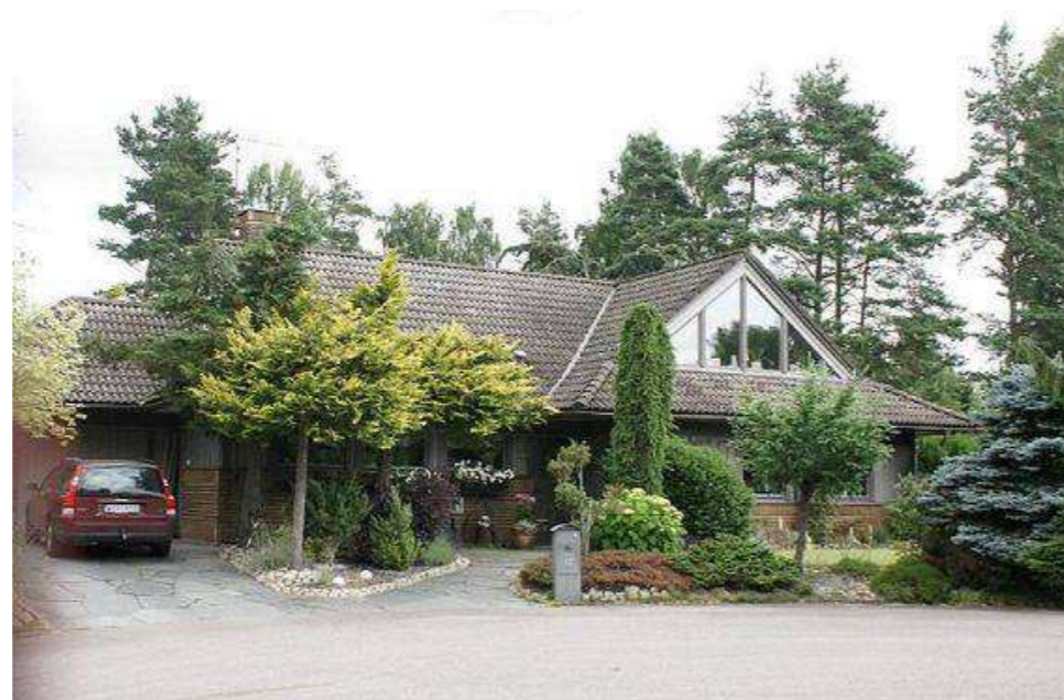
Ättikgurkan 2, Gnejsvägen 12

Stor enplansvilla som uppfördes i början av 80-talet efter ritningar av Lennart Nelssons arkitektkontor. Fasadmaterialiet är i huvudsak puts, träpanel täcker överbyggnadens fasad. Villan har sadeltak som täcks av betongpannor. Fönstren har en luft och är symmetriskt placerade på fasaden, de på bottenvåningen har spröjs i fönstrens nederkant.