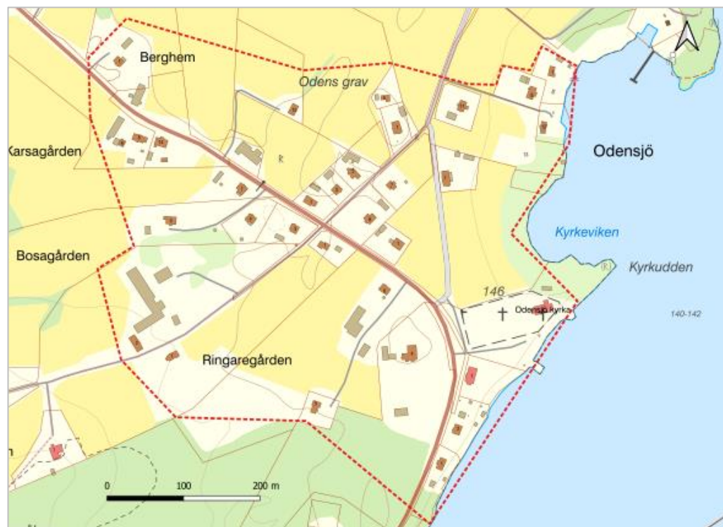
Figur 1. Föreslaget utbyggnadsområde för allmänt VA i Odensjö.