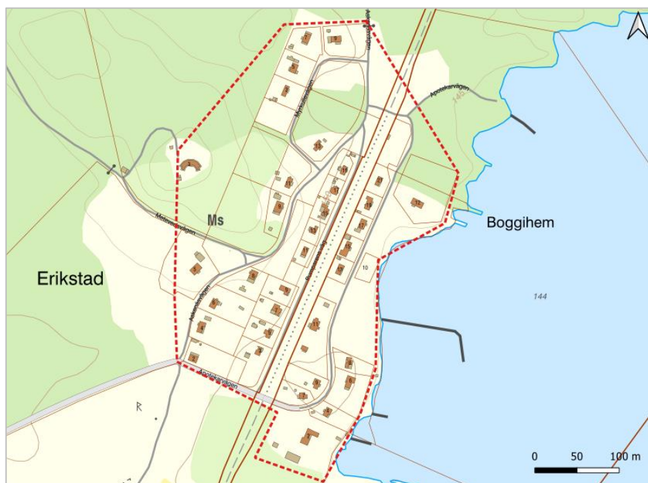
Figur 2. Förslaget bevakningsområde för allmänt VA i Erikstad.

Området utgör ett större sammanhang och föreslås som bevakningsområde. Då befintliga gemensamhetsanläggningar i dagsläget inte uppfyller miljökraven bör utvecklingen bevakas och ny klassning göras vid nästa revidering av vattentjänstplanen. Överlag bedöms att VA-försörjningen bör kunna lösas med gemensamhetsanläggningar så länge områdets karaktär (fritidshusområde) inte ändras väsentligt.